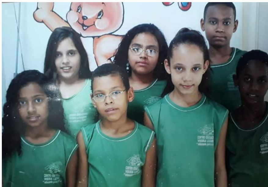
Imagem 5: Alunos do 4º ano

A segunda unidade nos possibilitou ainda mais expandirmos nossa rede educacional. Experiências ao ar livre, dinâmica, relações com outros alunos no recreio.