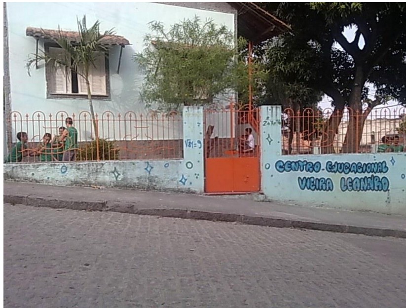
Imagem 4: Segunda unidade CE.VI.LE