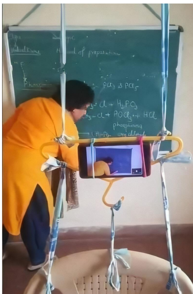
Imagem 3 – Professora improvisando tripé para dar aula.