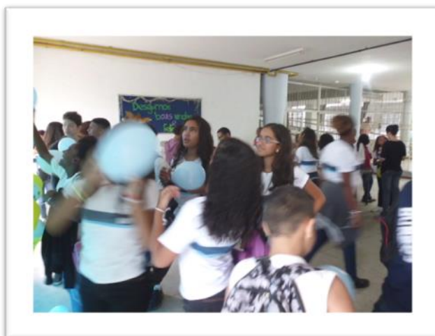
Figura 2: início do ano letivo na E.M. Orsina da Fonseca