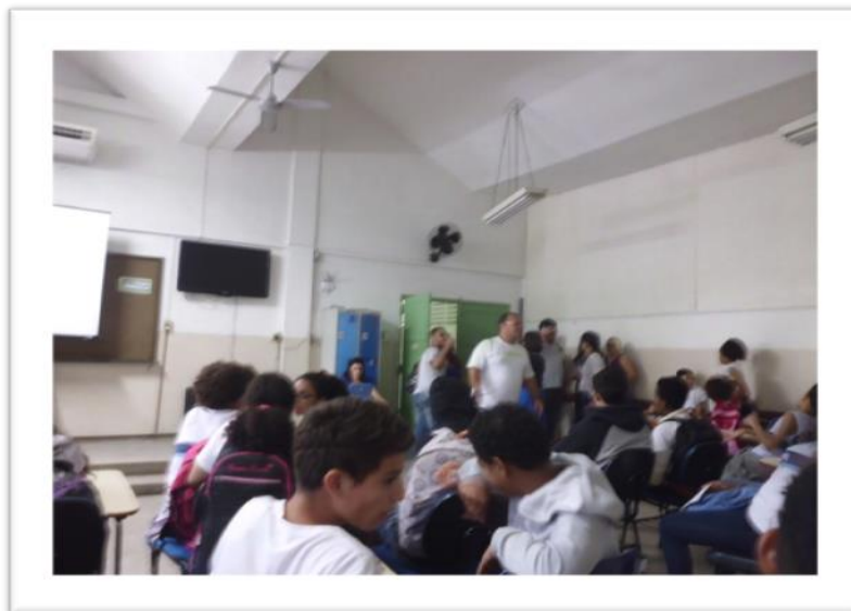
Figura 3: recepção no Auditório da E. M. Orsina da Fonseca.