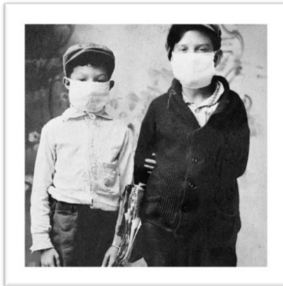
Figura 1: dois estudantes indo à escola durante a pandemia de 1918.