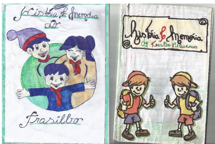
Fig. 1: Livretos produzidos pelas turmas 903 e 904 (2014)

Com esta inquietação, lancei o desafio de investigarmos as memórias escolares dos/as ex-alunos/as acerca das suas lembranças escolares. Como a maioria dos/as estudantes possui familiares e conhecidos que estudaram na escola, a tarefa foi vista