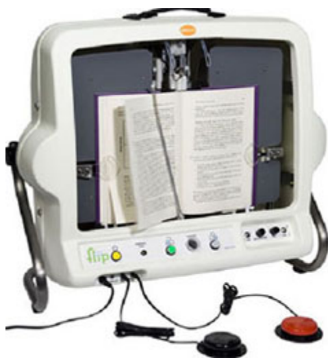
Ilustração 2 - site