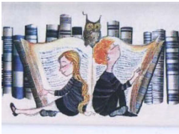
Ilustração 3 - site

reformulação da palavra dentro de uma rede de significados própria a cada indivíduo. Defendemos que a linguagem como forma de produção de identidade/diferença nas relações humanas e escola como força motriz desse processo, origina assim um movimento de ressignificações dentro do processo educativo. Contudo, ainda com Bakthin, é possível compreender que essa construção não se dá na busca de um sentido único, mas considerando a interação e o diálogo como forma de produção, isso ressalta o currículo como campo de enfrentamento entre diferentes discursos, atos de enunciação cultural que remetem a grupos diferenciados. Sendo assim, como espaço de diálogo e discussão, põe também em relação culturas que são valorizadas, compreendidas de formas diferentes, produzindo sentidos sobre essa relação, confirmando ou questionando estereótipos, grupos culturais, sujeitos e saberes.