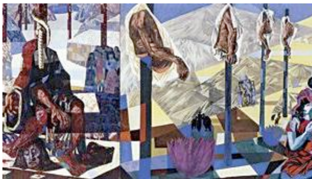
Fragmento 1 – Direita do Painel