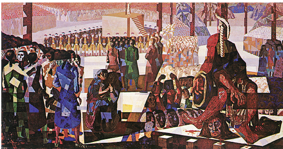
Fragmento 2 – Centro do Painel