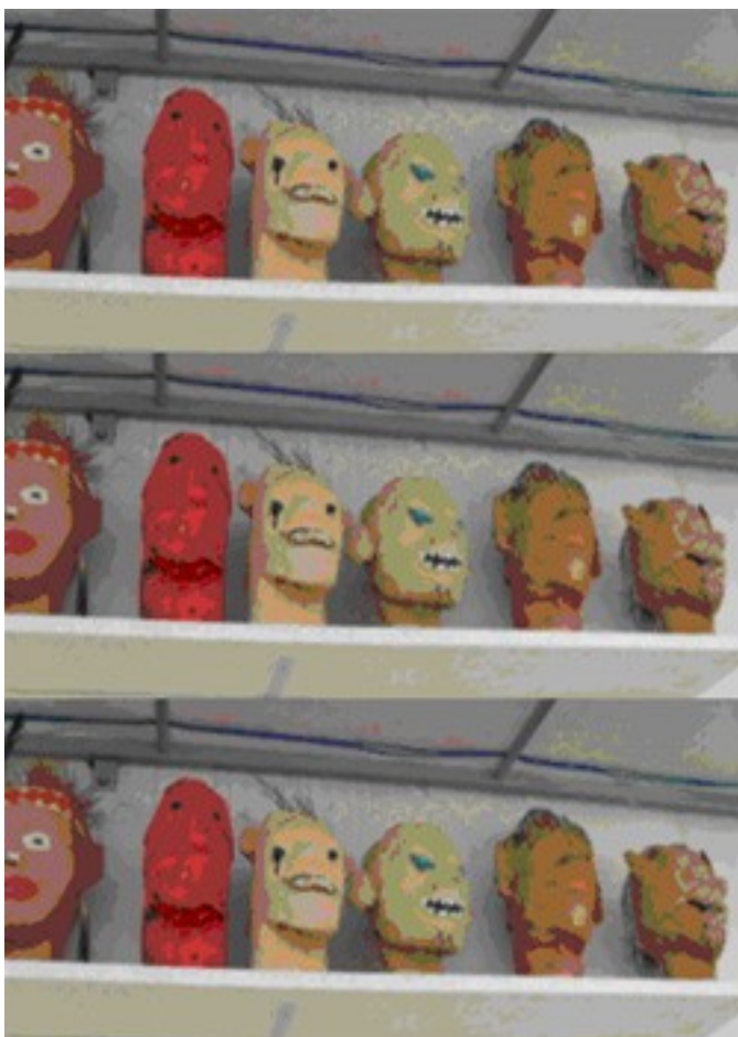
Legenda: fotografias de acervo pessoal.